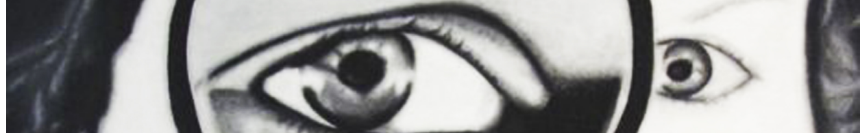
Detalle de foto: Maríel Herrera /2012