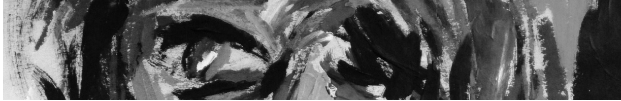
Detalle de pintura: Natalia Garzón/2012